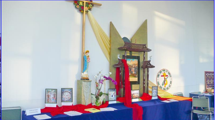
Triển lãm của người Việt Nam