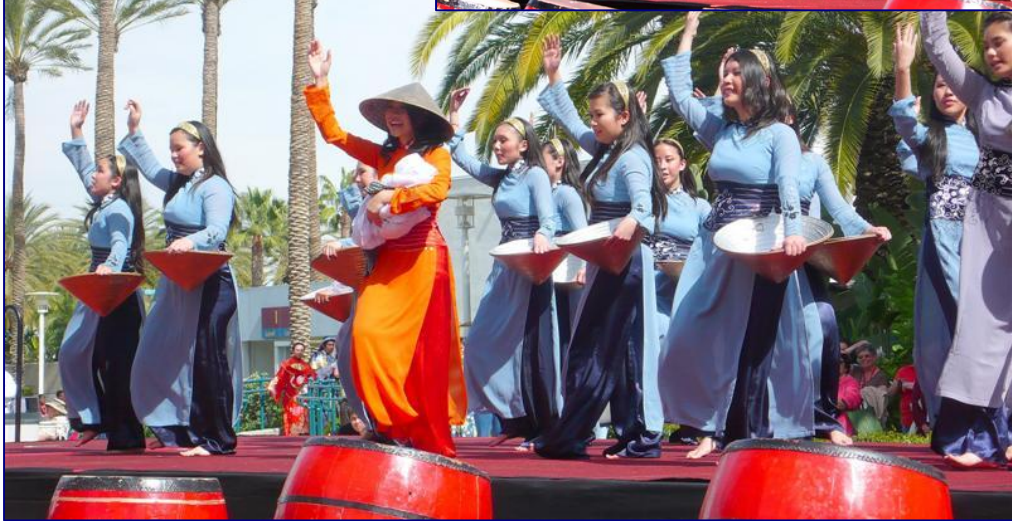
Đoàn múa Giới Trẻ VN Lasalle từ vùng Bay thu hút rất đông người xem và sẽ trở lại Nam Cali trong VYC III, July 3,4,5 tại Cal State Long beach

Các lớp học dành cho giáo dân người Việt đã được hưởng ứng rất đông đảo và nhiệt thành. Các lớp học cho người Việt mỗi ngày một lớn ra, các phòng dành cho các đề tài tiếng Việt đa số với số chứa trên dưới 500 người đều chật chỗ ngồi hoặc phải đứng hoặc ngồi trên sàn. Trong một số lớp, số người tham dự một nửa là các thầy cô giáo phụ trách về giáo lý trẻ em cũng như người lớn, một nửa là giáo dân muốn tìm hiểu thêm căn đạo Công Giáo.