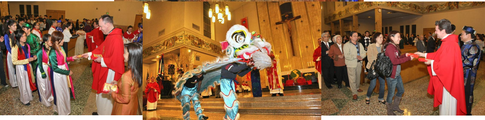
Lì xì, và lì xì cho cả cộng đoàn

Sau phần kết lễ ba cặp lân tiến từ cuối nhà thờ bắt đầu tiến lên qua 3 lối đi, lên cung thánh theo điệu trống lân. Các con lân này nhận những bao thơ lì xì từ các linh mục đồng tế trên cung thánh và cũng mở đầu cho cuộc vui của văn nghệ ngày Tết. Sau đó cộng đồng dân Chúa, già trẻ lớn bé cũng như quan khách, lần lượt đi lên từng người một nhận lộc lời Chúa do các linh mục ban tặng. Ai đây đều cảm được cái náo nức của ngày xuân, nay bắt đầu đến trong cộng đoàn Anaheim.