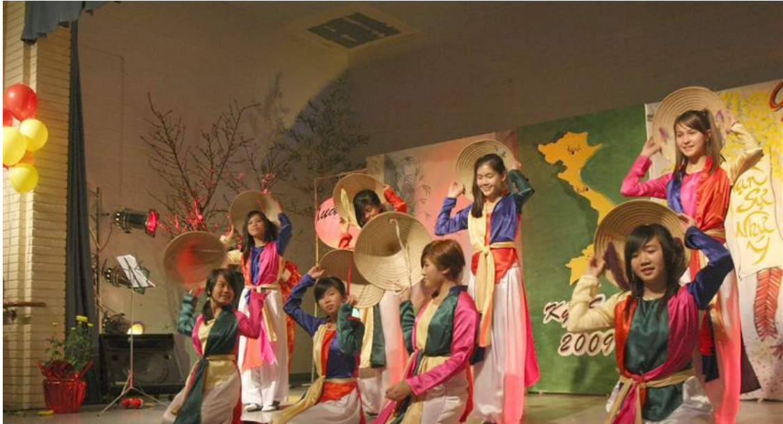
Các em thiếu nhi trình diễn rất đặc sắc trong phần văn nghệ