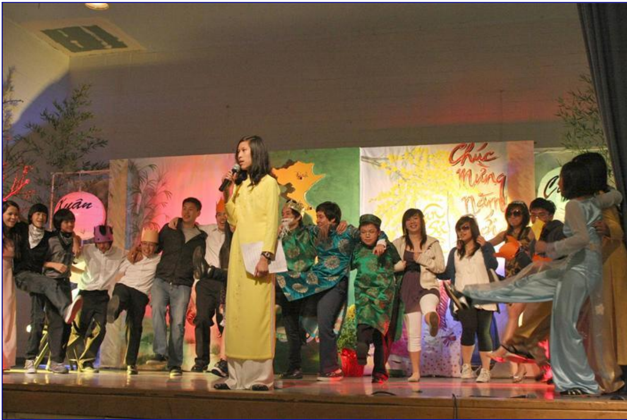
Xin kính chào cộng đoàn và kết thúc buổi văn nghệ tất niên

Cùng trong cuối tuần đó và tiếp tục vào tuần lễ sau, nhiều giáo xứ của 14 cộng đoàn Việt Nam cùng với cộng đồng người Việt tại quận Cam đã tổ chức vui Xuân thật nhộn nhịp, theo như truyền thống của người Việt Nam trong ngày Tết xuân.