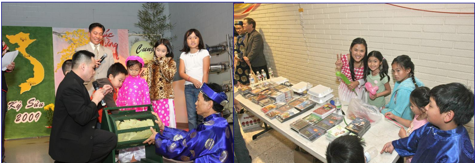
Các lô xổ số bắt đầu từ những món quà digital camera, đến laptop, và LCD TV. Lô độc đắc TV cuối cùng đã chấm dứt đêm văn nghệ Tết Kỷ Sửu cho năm 2009 cho cộng đoàn Anaheim.