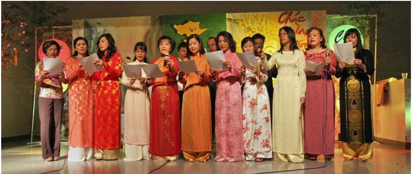
Ca đoàn trong ca khúc mở đầu cho mùa xuân