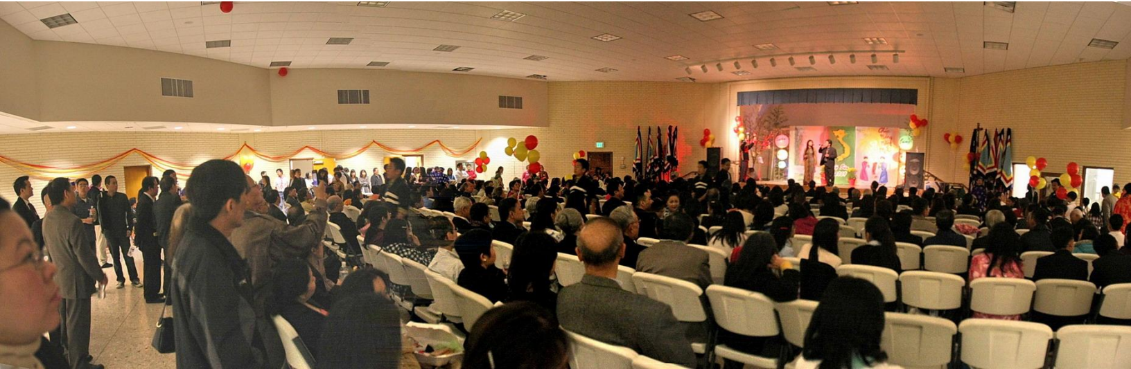
Hội trường về đêm